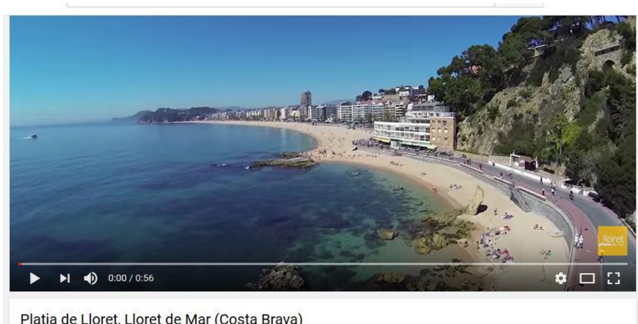
Platja de Lloret, Lloret de Mar (Costa Brava)