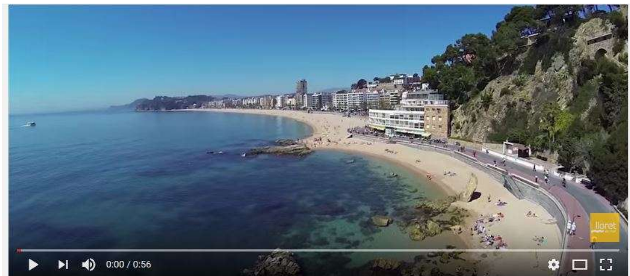
Platja de Lloret, Lloret de Mar (Costa Brava)